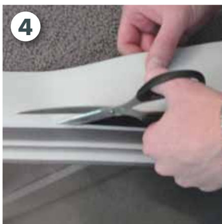
Motiv und Klebeband zuschneiden