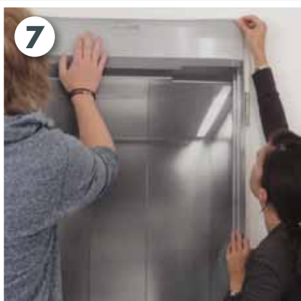
Door-Billboard an Innentür anbringen