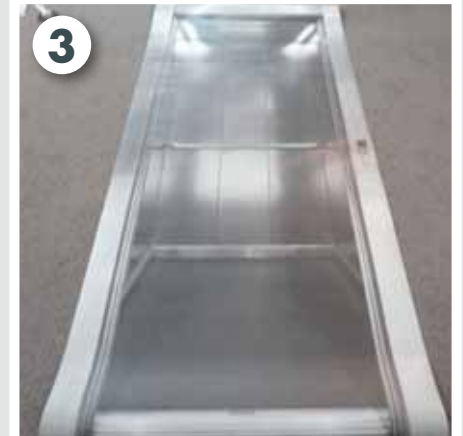
Motiv auspacken und ausbreiten