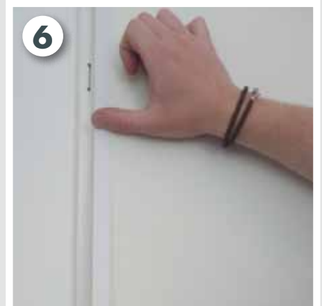
Klebeband an der Tür fixieren