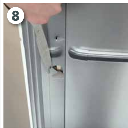
Türgriff markieren und einschneiden